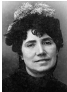
ROSALÍA DE CASTRO

conseguir calquera cousa que unha se propoña. O futuro é delas e seguro que pouco a pouco o han ir pintando de cor violeta.